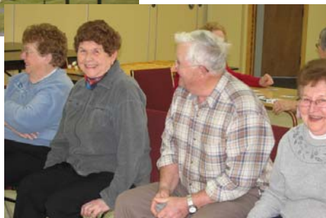
On joue aux sacs de sable au Club de loisirs des aînés.