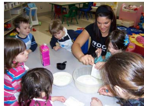
Cuisines collectives au Centre de la petite enfance de Cornwall.