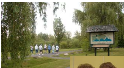
Promenade au parc pour le Club de marche.