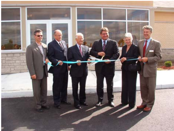
Août 2008: Ouverture officielle des locaux du CSCE à Bourget en compagnie de l'honorable David Caplan, Ministre de la Santé et des Soins de longue durée de l'Ontario