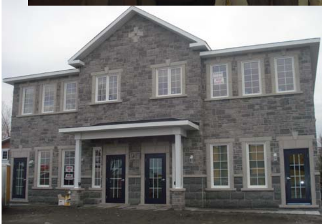
Novembre 2008: Conférence de presse pour le lancement du programme « Vieillir chez soi » et ouverture officielle des locaux du CSCE à Embrun.